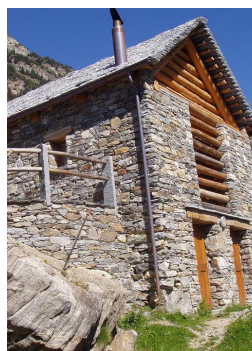
Agriturismo 1 (Scinghiöra)