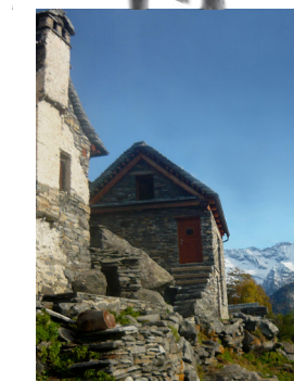
Agriturismo 2 (Curt du Munt)